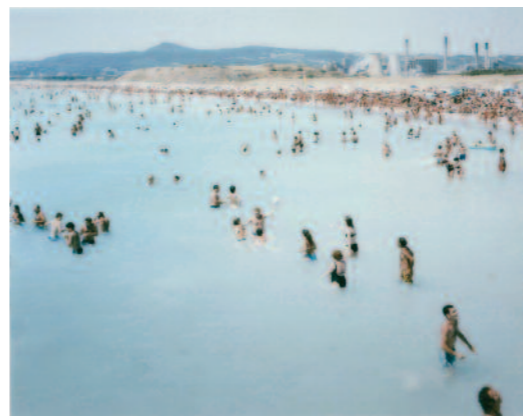
© VITALI MASSIMO, POSIGNANO, SOLVAY SEA 1, 1998, COLLECTION DE LA PROVINCE DE HAINAUT