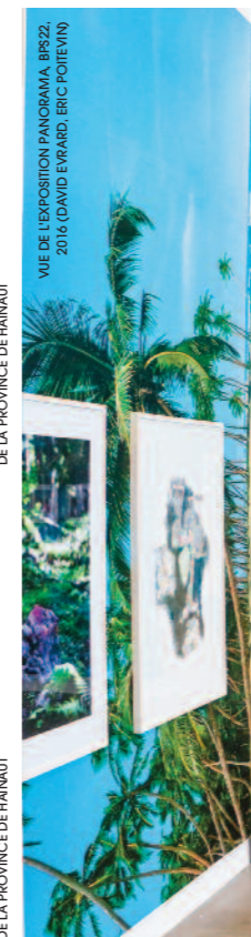
VUE DE L'EXPOSITION PANORAMA, BPS22, 2016 (DAVID EVRARD, ERIC POITEVIN)