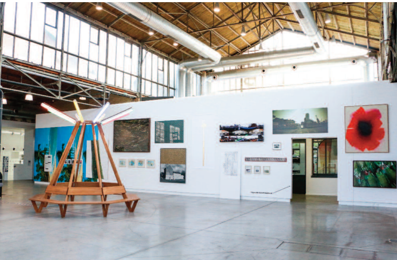
VUE DE L'EXPOSITION PANORAMA, BPS22, 2016